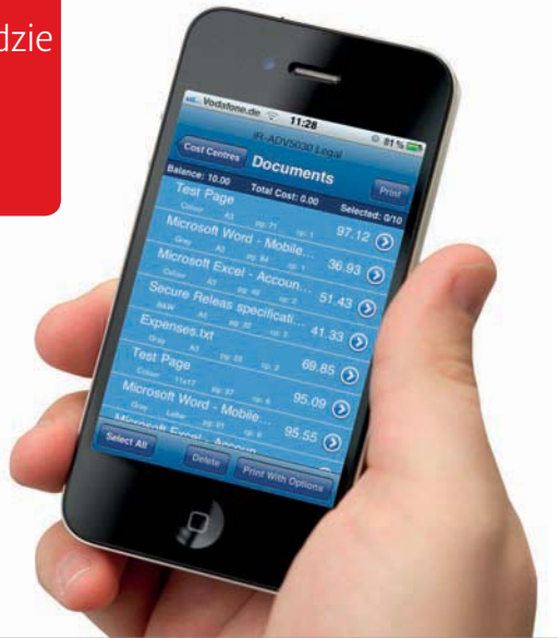
Natywna aplikacja dla telefonów iPhone

Wykonywanie codziennych zadań staje się możliwe z każdego miejsca. Zapotrzebowanie na bezpieczne, zarządzane zdalnie usługi drukowania staje się coraz bardziej istotne dla procesów biznesowych. Platforma uniFLOW zapewnia użytkownikom swobodę drukowania — z komputera, chmury lub urządzenia mobilnego.